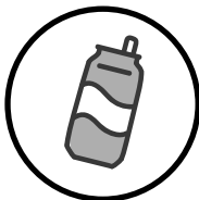
_____ Canettes en aluminium