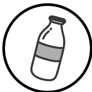
_____ Bouteilles en verre