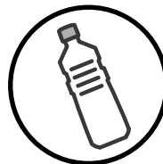
_____ Bouteilles en plastique